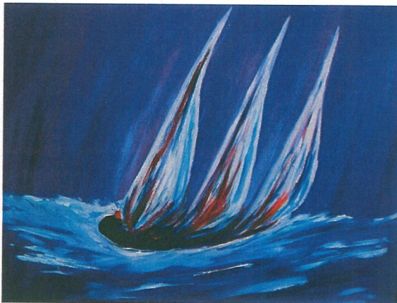
„Le Bateau Ivre“, Öl auf Leinwand, 2003 (100 x 80 cm)