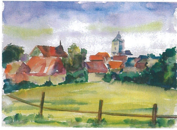
„Wolfhager Land“, Aquarell, (18 x 25 cm)

nehmung des Künstlers, der seine Impulse weniger aus optisch und rational erklärbaren Tatsachen erfährt, als aus psychischen Erregungen und verschlüsselten Erlebnissen, die in der Artikulation von innen nach außen treten“, schreibt Freitag anlässlich der Kasseler Ausstellung der Gruppe „En Bloc“ mit dem programmatischen Titel „Landschaft um mich – in mir“ (Frühjahr 2002).